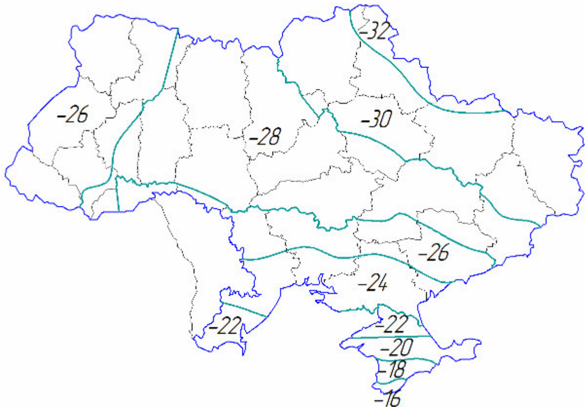
Рисунок 1 – Територіальне районування України за характеристичним значенням температури найхолоднішої доби t_{c0}

З наведених нижче карт (рис.1, 2, 3) видно, що прийняті параметри забезпечили отримання досить плавних і систематично розміщених меж територіальних районів (ізотерм). У деяких випадках межі територіальних районів суміщені з межами адміністративних областей, поблизу яких вони проходили, що забезпечує однозначність рішення щодо віднесення певних населених пунктів чи територій до тих або інших районів.