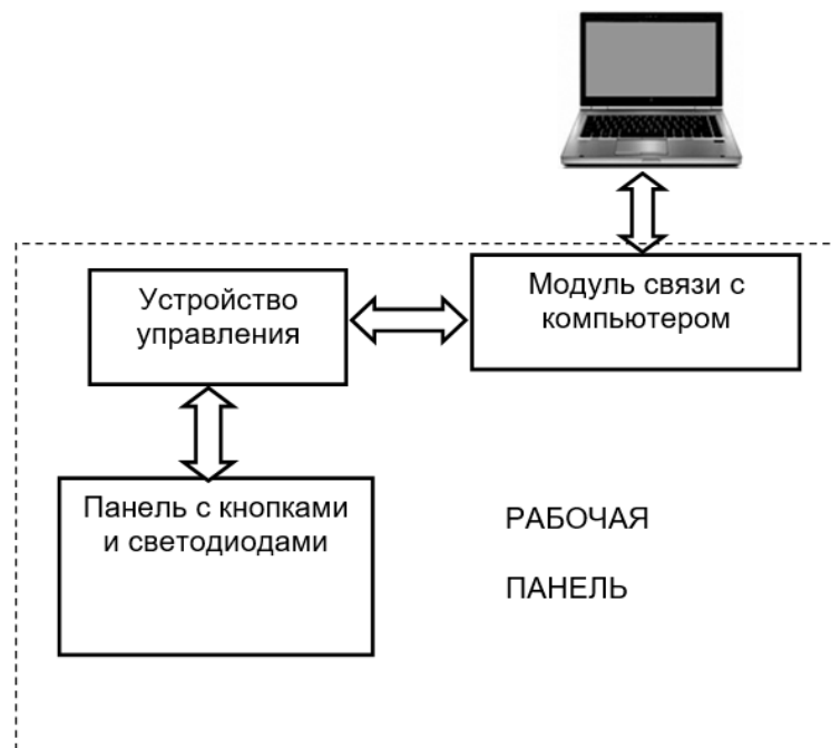
Рис. 1. Структура системы для определения времени сложной зрительно-моторной реакции

Предлагаемая система позволит облегчить оценку действий пациента путем измерения времени реакции и точности движений, при этом исключается фактор субъективности. Функциональные возможности системы можно расширить изменением размера и формы рабочей панели. Также можно сделать рабочую панель с изменяемым цветом участка, на котором расположены кнопки. Кроме этого, работа с данной системой возможна и без врача, при этом все результаты сохраняются в компьютере.