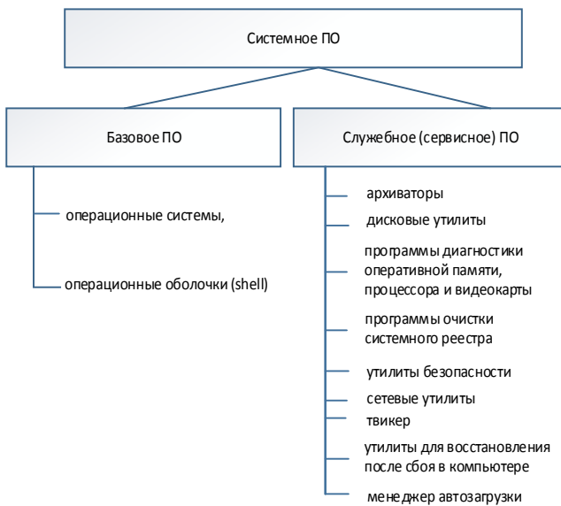
Рис. 1. Классификация системного ПО

Из литературы [1-8] известно, что системное ПО это совокупность программ для управления аппаратурой компьютера и обеспечения работы прикладных программ. Классификация системного ПО представлена на рис. 1.