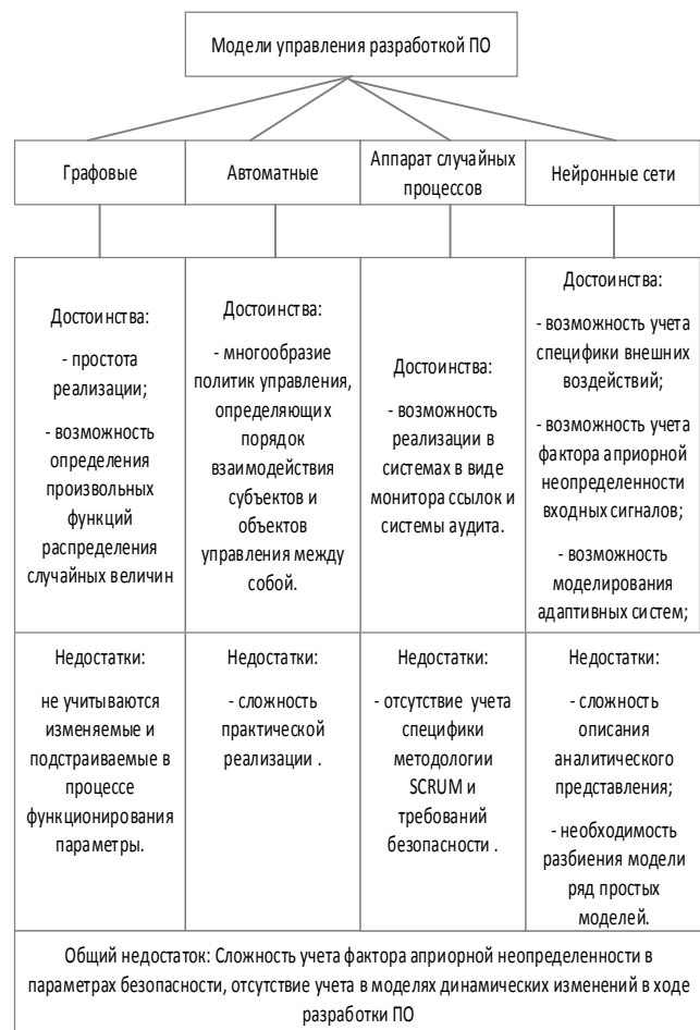
Рис. 4. Сравнительная характеристика наиболее известных подходов математической формализации процесса управления разработкой системного ПО

На рис. 4 представлена сравнительная характеристика наиболее известных подходов математической формализации процессов управления разработкой с указанием их достоинств и недостатков.