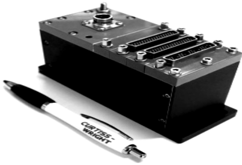
Рис. 3. Варіант системи ACRA control AXON

Найбільший інтерес для безпілотних ЛА являє собою система AXON, вона розроблялася безпосередньо для цих цілей. Широкий функціонал, малі габарити і вага роблять її ідеальною для збору даних з БпЛА. Недолік один - система імпортна і її велика ціна.