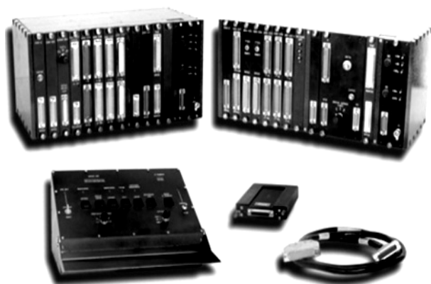
Рис. 1. Зовнішній вигляд СБВ ГАММА-2110

Комплекс бортових агрегованих засобів збору, перетворення і реєстрації інформації ГАММА-2110 призначений для вимірювання параметрів дослідних об'єктів, перетворених в електричні сигнали, запису результатів вимірювань паралельним двійковим кодом на магнітну стрічку з можливістю подальшої обробки та аналізу при проведенні льотних випробувань авіаційної техніки.