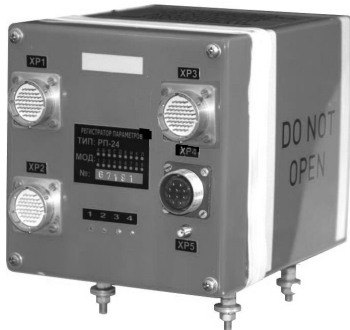
Рис. 5. Зовнішній вигляд реєстратора польотної інформації РП-24

Також в роботі [11] було розглянута можливість використання засобів об'єктивного контролю, в особливості реєстратора РП-24, в якості СБВ для застосування в якості малогабаритної системи бортових (об'єктових) вимірювань під час випробувань зразків ОВТ. Була здійснена оцінка достатності технічних характеристик дослідного зразка реєстратора польотних даних. Реєстратор польотних параметрів РП-24 призначений для збору, підготовки і запису в захищені твердотільні флеш-накопичувачі параметричних даних та аудіо інформації, що створюються на повітряному судні, та її копіювання на наземні засоби перезапису для подальшої обробки (рисунок 5).