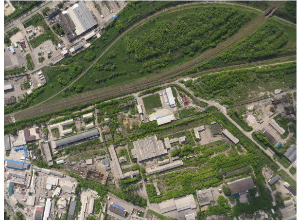
Рис. 1. Вихідне зображення

У якості вихідного будемо розглядати тонове оптико-електронне зображення з бортової системи оптико-електронного спостереження Ikonos (рис. 1) [16]. Зображення з виділеними границями з використанням детектору границь Канні зі значеннями масштабних коефіцієнтів K_m=1; 2; 4; 8; 16 наведені на рис. 2. Результат об'єднання перетворення Хафа для різних значень масштабного коефіцієнту наведений на рис. 3. Кружечками на рис. 3 позначені локальні максимуму у параметричному просторі.