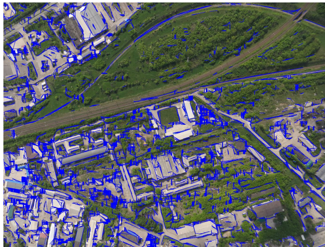
Рис. 4. Результат роботи методу багатомасштабного оброблення зображень