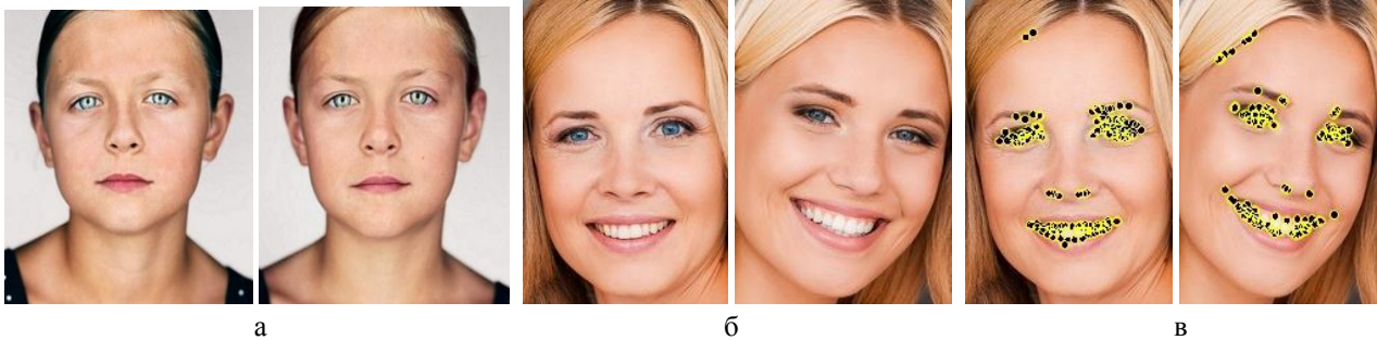
Рис. 1. Зображення: а – близнюків; б – матері та доньки; в – з координатами КТ

Оцінювання результативності застосування кластерного апарату відбувалось на прикладі задачі ідентифікації людських облич, зокрема, з метою виявлення ступеня схожості фотографій близнюків та родичів. На рис. 1, а, б наведено приклади досліджуваних об'єктів за зображеннями розміром 250x260. Експерименти проводилися з числом кластерів k=2, 3, 5 . Приклад координат виділених детектором BRISK КТ представлено на рис. 1, в. Кількість встановлених КТ для зображень рис. 1 дорівнювала 160, для зображень рис. 1, б – 115.