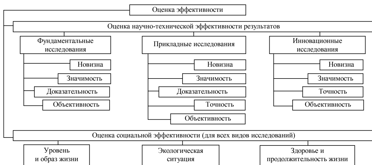
Рис. 1. Структура системы критериев оценки эффективности исследований

Таким образом, систему критериев оценки эффективности научных (фундаментальных) исследований, научно-технических (прикладных) и инновационных разработок можно представить следующей иерархической структурой (рис. 1). На рис. 2 приведен пример показателей оценки научнотехнической эффективности результатов прикладных исследований.