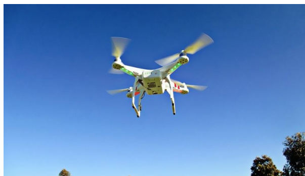
Рис. 2. Приклад серійної моделі квадрокоптера для цивільних задач моніторингу

На рис. 2 - 6 показані різні варіанти конструкцій квадрокоптерів із підвіскою для відеокамер. На рис. 7 демонструється схема мультикоптера з шістьма гвинтами – гексакоптер. Максимальна кількість несучих гвинтів принципово не обмежується, але в реалії обмежується вісьма силовими двигунами з міркування оптимального використання живлення бортовими пристроями та гвинтомоторною групою [8].