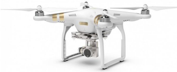
Рис. 3. Приклад квадрокоптера із зовнішньою підвіскою з курсовою камерою