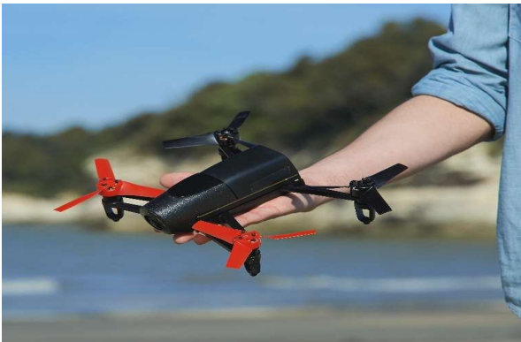
Рис. 5. Приклад мініквадрокоптера без відеокамери і підвіски