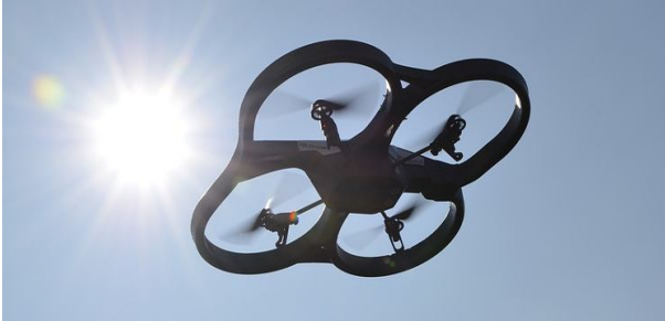
Рис. 4. Приклад конструкції БПЛА рамкового типу