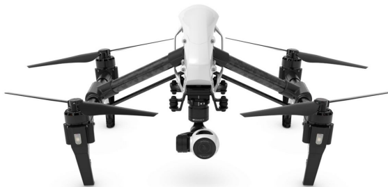
Рис. 6. Квадрокоптер Inspire 1 V2.0 з відеокамерою на керованій платформі