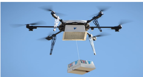
Рис. 7. Приклад гексакоптера класу «міні» із зовнішньою підвіскою вантажем

Чим більше двигунів – тим більше живлення потребує апарат і тим більша повинна бути ємність батарей. Але чим більше двигунів, тим більше вантажопід'ємність апарату та менше польотний час і тим меншу дальність може подолати безпілотник. В той же час, чим більше обертів двигунів в одиницю часу, тим більше вантажопід'ємність і тим вище може піднятися БПЛА. В протилежність останнього, чим більше двигунів, тим складніше керування апаратом, збільшуються його габарити, а як наслідок збільшується «парусність». Пориви вітру на висоті можуть частіше перевертати літальний апарат, «здувати» його з курсу і для підтримки заданого напрямку польоту буде витрачатися більше живлення.