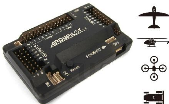
Рис. 1. Бортовий контролер для мультикоптера

Комплекс сумісний з радіоканалом імпульсно-кодів модуляції (ІКМ) і дозволяє управляти БПЛА як в ручному режимі зі стандартного пульта дистанційного керування, так і в автоматичному по командам автопілота.