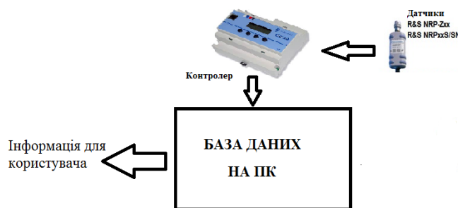
Рис. 3. Схема підключення датчиків до контролера

Перевагами при підключенні датчиків до контролера, можна вважати те, що не потрібно мати цілодобово включений комп'ютер. У зручний час для користувача, можна увімкнути комп'ютер і закачати на нього інформацію з контролера, на який поступали дані з датчиків і приладів які вмикалися за певний час. ПЗ проведе аналіз і покаже стан системи. Але це за умови, якщо контролер модернізувати, установити на нього додаткові блоки пам'яті, процесор, та додатково його запрограмувати. А це можна віднести до недоліків цього способу підключення.