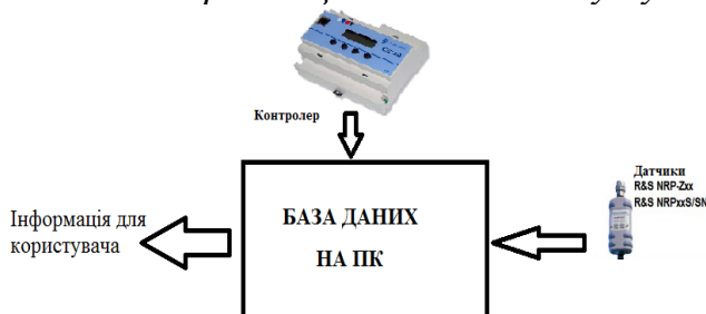
Рис. 2. Схема підключення датчиків до ПК