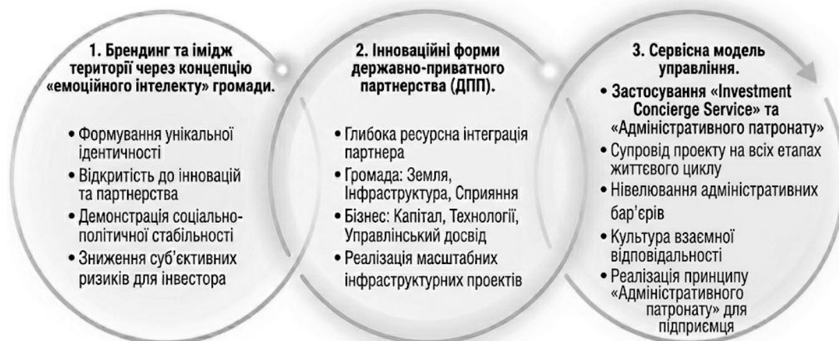
Рис. 2. Прикладні інструменти публічного управління стратегічним інвестиційним розвитком територій

Переведення теоретичної парадигми стратегічного розвитку в площину практичної реалізації вимагає імплементації специфічного інструментарію публічного управління, що здатний виступити каталізатором інвестиційної активності та сформувати унікальні конкурентні переваги територій, а саме (рис. 2):