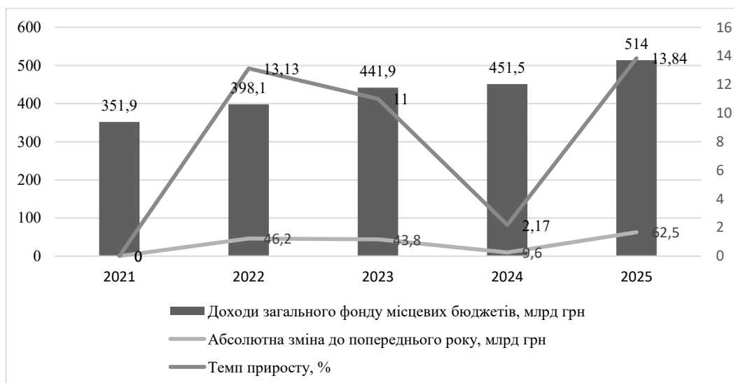
Рис. 1. Динаміка доходів загального фонду місцевих бюджетів України у 2021–2025 рр.