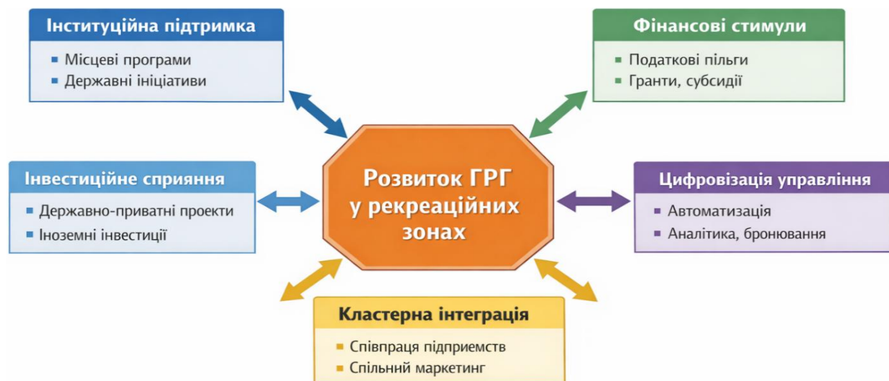
Рис. 3. Комплексна модель підтримки готельно-ресторанного господарства у рекреаційних зонах