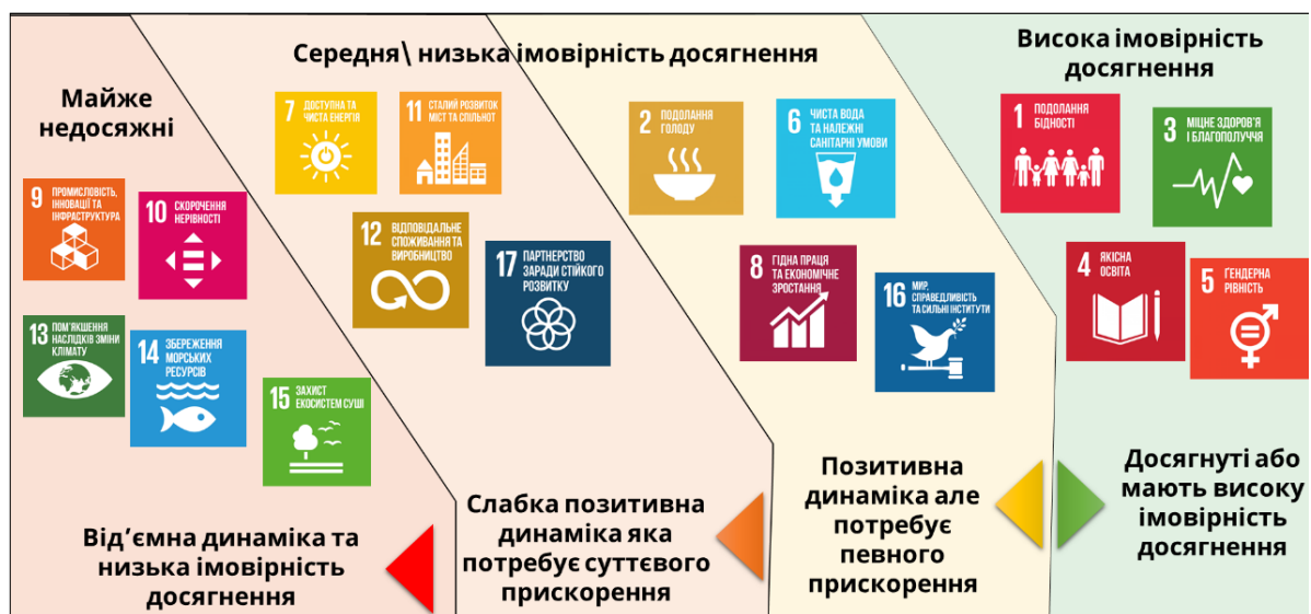
Рис. 1. Результати моніторингового звіту «Цілі сталого розвитку: Україна – 2020 рік» у розрізі можливості досяжності цілей

При складанні моніторингового звіту досягнення цілей сталого розвитку у 2020 році передбачались цілі, які можна було досягти однак після початку світової пандемії економіка країни вже вимагала