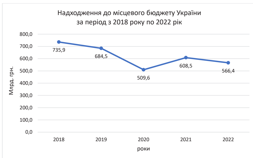
Рис. 2. Надходження до місцевого бюджету України за 2018–2022 роки

Бюджетна децентралізація в Україні почала реалізовуватися з 2015 року однак останній етап її завершився тільки наприкінці 2021 році, тому залишається актуальним аналіз наслідку цієї частини реформи. За результатами наукового дослідження надходження до місцевих бюджетів мають нестабільну динаміку. Після завершального етапу фінансової децентралізації доходи місцевого бюджету України надходження значно зросли, однак після першого року війни знову спостерігається їх зниження. Це може свідчити про різні економічні явища. По перше згідно графіка відображеного на рисунку 2 можна спостерігати, що періоди падіння доходів припадають на роки соціальних викликів, а саме на період початку пандемії та початку війни в Україні. Другим фактором може бути період адаптації національної економіки до реформи децентралізації. Також вищесказані фактори можуть діяти комплексно [16].