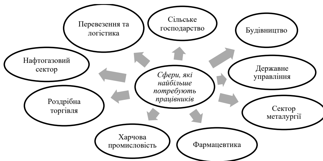
Рис. 1. Сфери, які найбільше потребують працівників за даними Державної служби зайнятості на травень 2022 р.

Дисбаланс посилюється через міграцію українців до Європи та мобілізацію чоловіків. 30 травня 2022 року у Центрі зайнятості назвали найпотрібніші професії під час війни (рис. 1) [4].