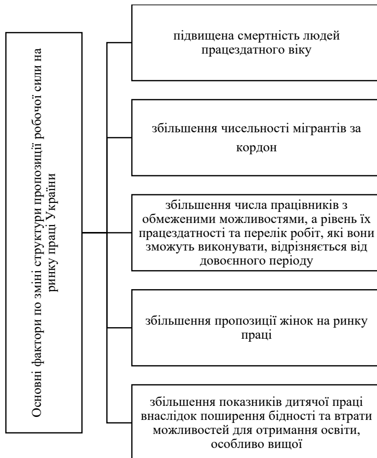
Рис. 4. Основні фактори по зміні структури пропозиції робочої сили в Україні

6. Сприяння вирішенню безпосередніх проблем вразливих верств населення, які не можуть займатися економічною діяльністю через вік, фізичні вади або з інших причини.