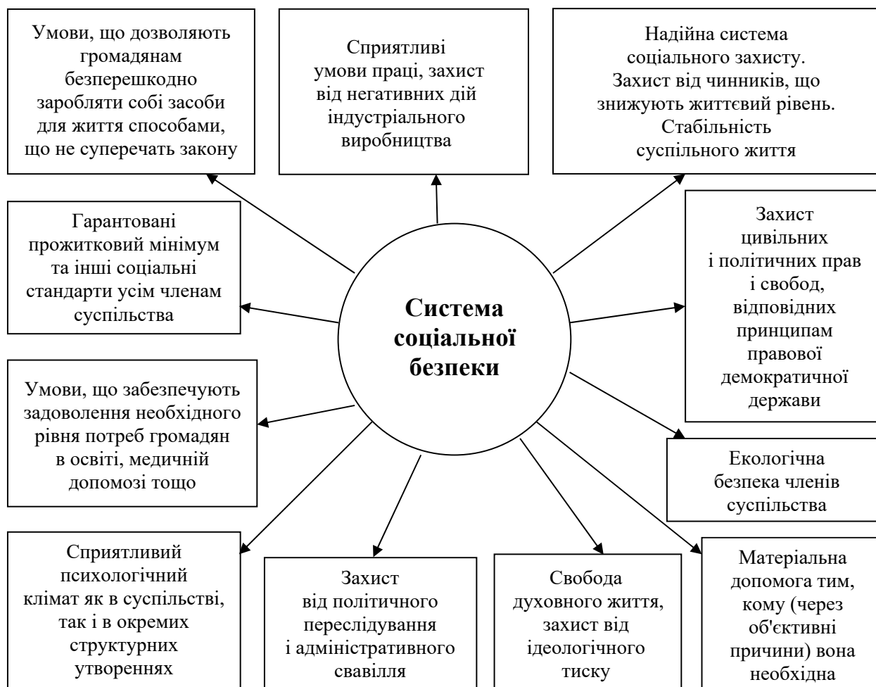
Рис. 1. Структурні елементи соціальної безпеки держави