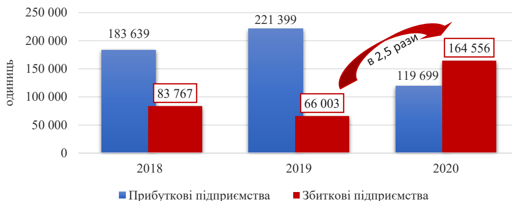
Рис. 1. Співвідношення прибуткових та збиткових підприємств України у 2018–2020 рр.

Для обґрунтування впливу на рівень фінансової безпеки бізнесу важливо дослідити чутливість інтегральних субіндексів до зміни відповідних показників. Для оцінювання взаємозалежностей між показниками фінансової безпеки використаємо кореляційний аналіз. Використаємо показники розвитку бізнесу в Україні у 2015–2021 рр. табл. 1. Нехай X_i = \{x_{ij}\}_{j=1}^m – підмножина множини X показників фінансової безпеки, що включає показники певного виду (кількість суб'єктів господарювання, млн. од, індекс чистий прибуток (збиток) підприємств, млрд. грн). Кожному показникові x_{ij} відповідає нормалізований