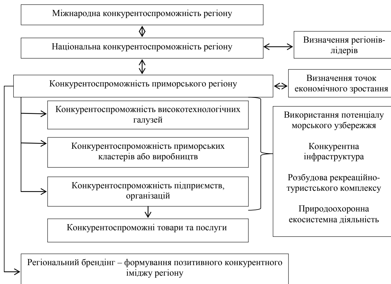
Рис. 1. Особливості структури конкурентоспроможності приморського регіону

виробництв та галузей регіону), приморських кластерів, підприємств та організацій, що формують конкурентоспроможні товари та послуги для споживачів – мешканців та гостей регіону (рис. 1).