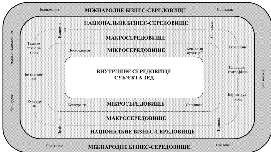
Рис. 3. Модель середовища функціонування суб'єкта ЗЕД (адаптовано за роботою [1, с. 427])

взаємодії суб'єктів ЗЕД з іншими суб'єктами та можливі сценарії розвитку подій у контексті запобігання негативним явищам і тенденціям.