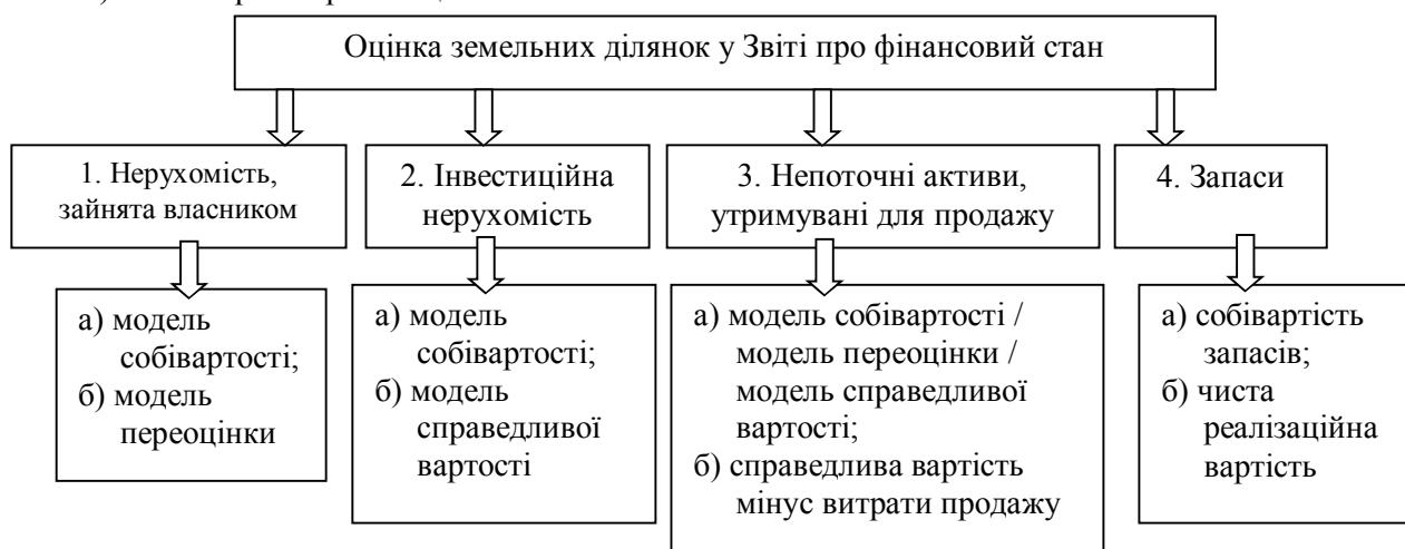
Рис. 1. Існуючі моделі оцінки земельних ділянок у фінансових звітах за МСФЗ

Фактично формул розрахунків балансової вартості земельних ділянок існує ще більше, якщо врахувати земельні ділянки, що є об'єктами фінансової оренди, які лізингоодержувач має визнавати за меншою з величин: